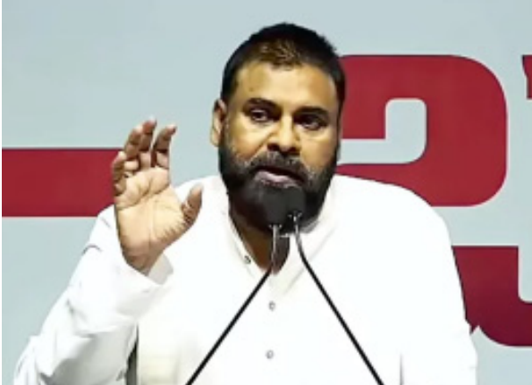
చేయాలి" అని పవన్ పేర్కొన్నారు.

మంగళగిరి: యువతకు సరైన వేదికగా మారాలనే పార్టీ పెట్టినట్లు ఏపీ డిప్యూటీ సీఎం పవన్ కల్యాణ్ తెలిపారు. కొత్త పంథాను నమ్ముకొని అనేకమంది యువత నక్సల్స్ లో చేరారని, సిద్ధాంతాలను పదలేక వేలాది మంది చనిపోయారని అన్నారు. ఐదియాలజీ సరైంది కాకపోతే అనేక ఇబ్బందులు వస్తాయన్నారు. మంగళగిరిలోని సీకే కన్వెన్షన్ లో జనసేన నిర్వహించిన 'పదవి-బాధ్యత' సమావేశంలో పవన్ మాట్లాడారు. ఎన్నికల్లో ఓడిపోయినా పార్టీ కోసం బలంగా నిలబడారని అందుకే మీ అందరికీ పదవులు వచ్చాయన్నారు. అందరూ కలిస్తేనే సమాజం తయారైందని తెలుసుకోవాలన్నారు. "కూర్చోబెట్టి ఊకదంపుడు ఉపన్యాసాలు చేయడం వుభా. ప్రతి వంద కిలోమీటర్లకు మన భాష, అలవాట్లు, ఆచారాలు మారిపోతున్నాయి. పర్యావరణాన్ని పరిరక్షించేందుకు అనేక చర్యలు చేపడుతున్నాం. దురాశతో పర్యావరణానికి తీవ్రంగా నష్టం చేస్తున్నాం. పర్యావరణాన్ని పరిరక్షించే అభివృద్ధి జరగాలని కోరుతున్నాం. మనం ఏం పని చేసినా రాజ్యాంగానికి లోబడే పని